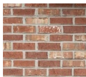
ショーブリック カナダ製