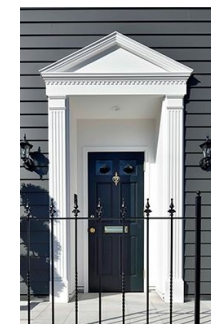
玄関装飾イメージ