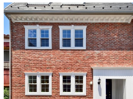
窓まわり: トレパーツ・軒下、玄関まわり: スペクタス